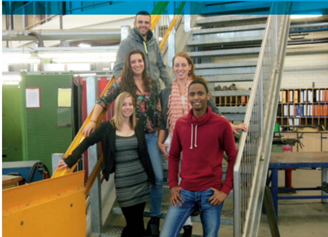
S-team ROC Friese Poort

beter', aldus De Breij. 'Het is ook niet bedreigend, want het S-Team staat los van cijfers, het schoolprotocol en allerlei maatregelen.'